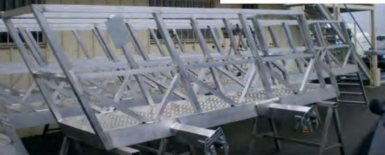
Ensemble mécano-soudé d'outillages et de chaînes de montage de type aluminium ou acier