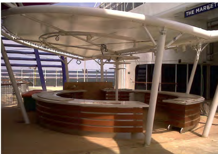
Structures métallo-textile design

Special and unique architectural structure for a bus stop in Nantes town centre (Duchesse Anne stop)