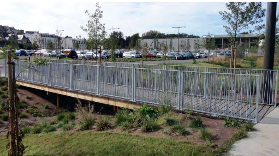
urbain sur-mesure (ville de Quimper)

Made-to-measure metallic urban handrails and features (Quimper town)